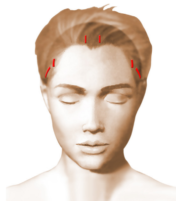
Incisions = cicatrices

Ces incisions permettent le passage de l'endoscope relié à une mini caméra-vidéo et livrent passage aux différents instruments spécifiquement adaptés à cette chirurgie endoscopique.