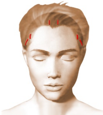
incisions = cicatrices

Elles font entre 5 et 10 mm, sont au nombre de trois à cinq, et sont placées dans le cuir chevelu, quelques centimètres en arrière de la lisière des cheveux du front. L'une d'elles permettra le passage de l'endoscope relié à une mini caméra-vidéo, les autres livrent passage aux différents instruments spécifiquement adaptés à cette chirurgie endoscopique.